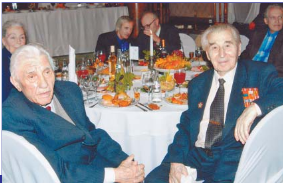
Ветераны на юбилее предприятия

– Воспетые в песнях и фильмах о войне "фронтовые наркомовские сто грамм" скорее поэтический образ, чем боевая реальность. Их выдавали чаще всего перед стыковой атакой. Думаю, зря выдавали. Потому что живыми из рукопашной чаще всего выходили те солдаты, кто шел в драку трезвым. Они четче контролировали действия свои и